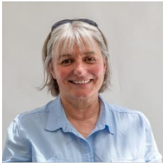
Mme Maryse BEYRIE Conseillère départementale des Hautes-Pyrénées