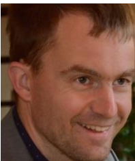
M. Domitien DETRIE Agence des Pyrénées