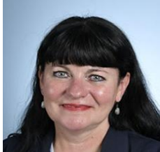
Mme Sandrine DOGOR-SUCH Députée des Pyrénées-Orientales