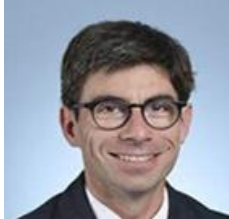
M. Benoît MOURNET Député des Hautes-Pyrénées